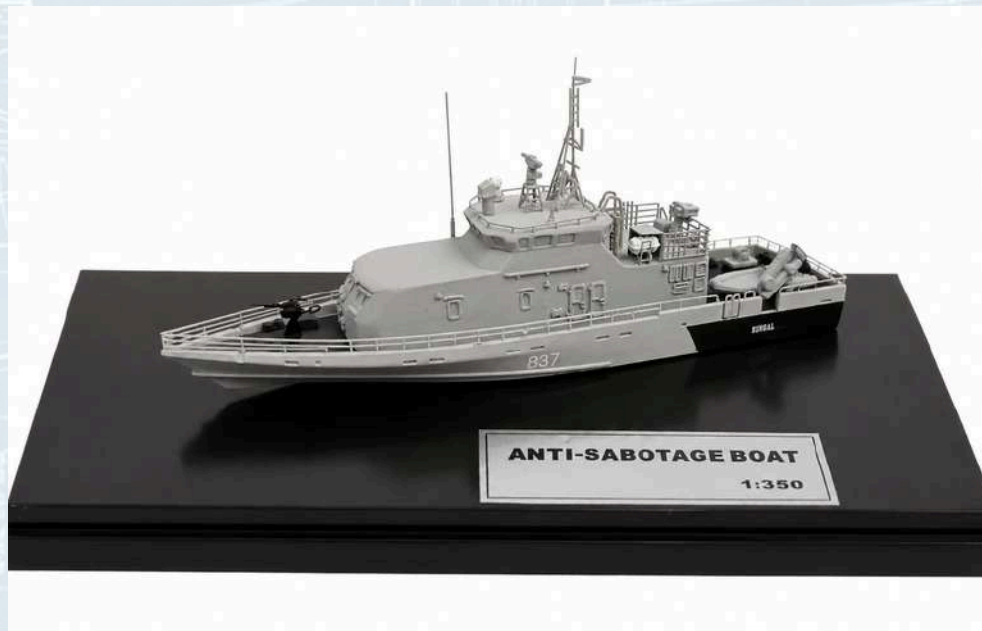
Razred C-3, Izložak br. 7a

Damir Ušalj, Rijeka "Anti-sabotage boat" Patrolno plovilo