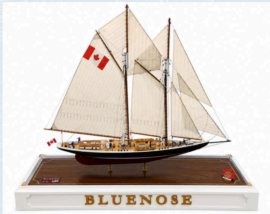
Razred C-1, Izložak br. 2

Leonard Peršić, Pula "Optimist" Brod na jedra