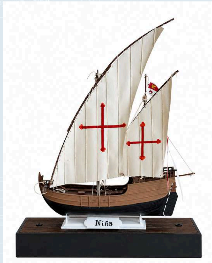
Razred C-6, Izložak br. 16