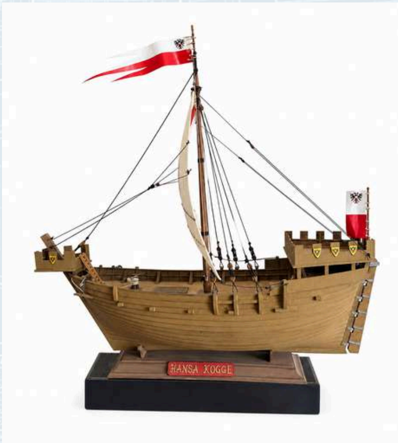
Razred C-6, Izložak br. 15