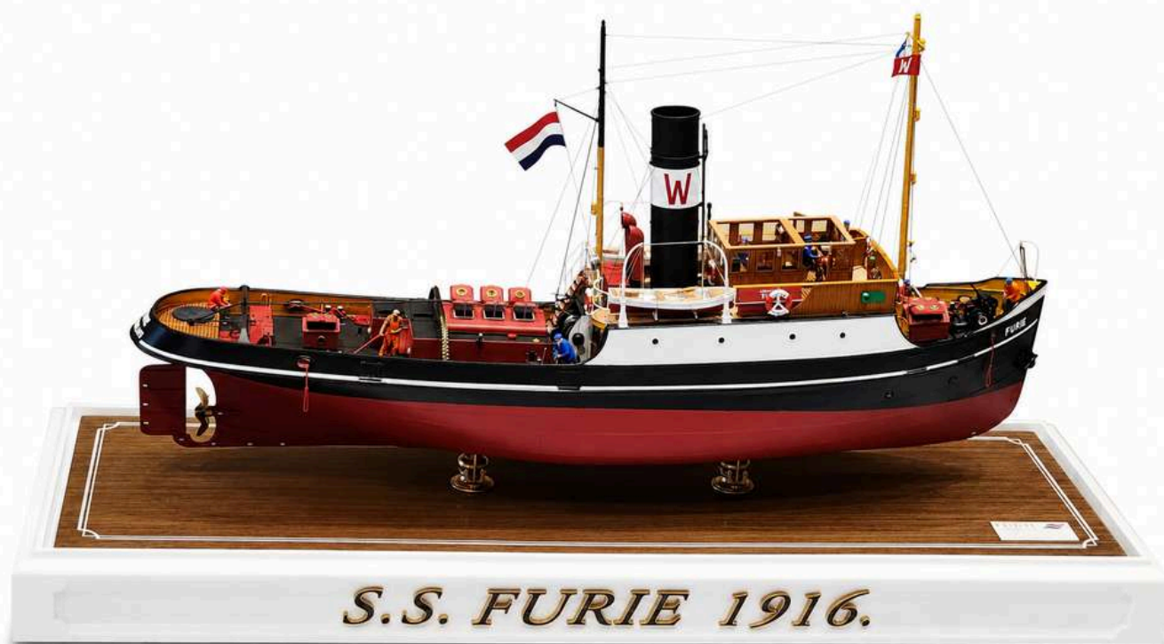
Razred C-8 Izložak br.20