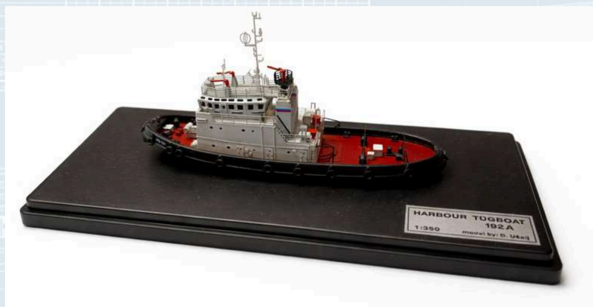
Razred C-3, Izložak br. 8

Damir Ušalj, Rijeka "Multifunctional boat" Višenamjensko ratno plovilo