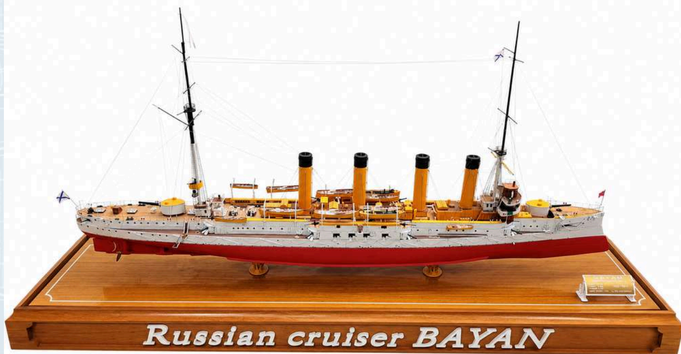
Razred C-7, Izložak br. 18

Roland Vlahović Lovran "Bayan" Oklopni krstaš