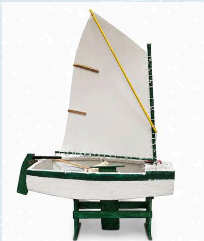
Razred C-1, Izložak br. 1

Leonard Peršić, Pula "Optimist" Brod na jedra