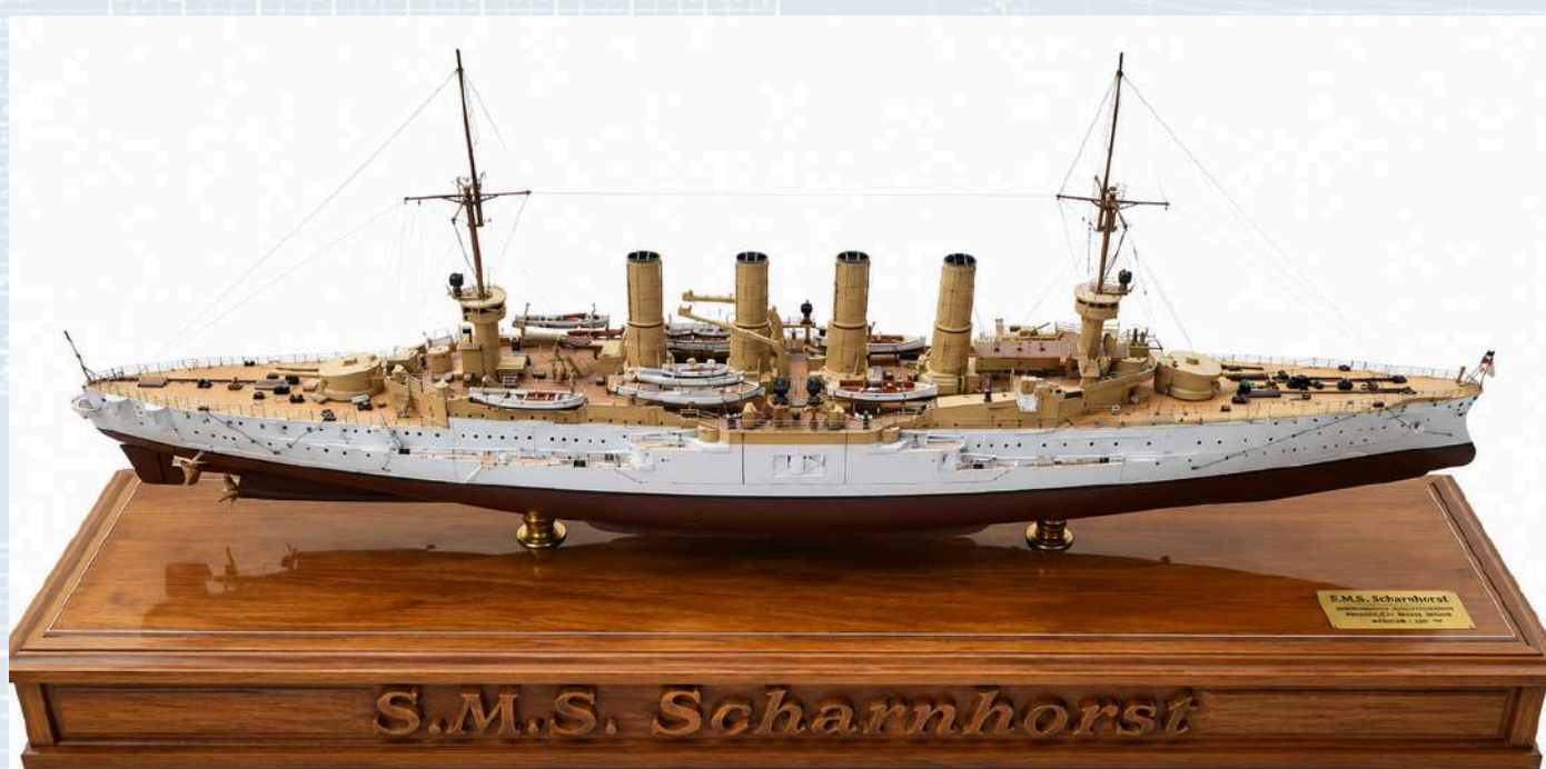
Razred C-7, Izložak br. 19