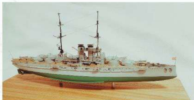
Razred C-6, Izložak br.10 SMS Szent Istvan Luka Ušalj, Rijeka