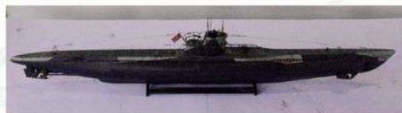
Razred C-8, Izložak br.27 Podmornica Type VII Igor Petrović, Rijeka