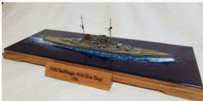
Razred C-3, Izložak br.9 SMS Derfflinger Luka Ušalj, Rijeka