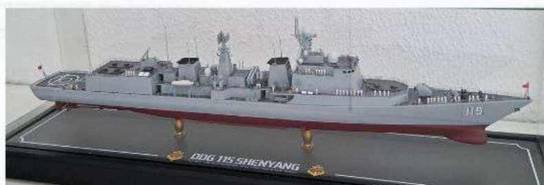
Razred C-6, Izložak br.13 PLAN Navy Type 051C - DDG-115 Shenyang Marko Smoković, Rijeka