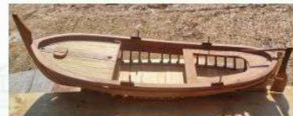
Razred C-1, Izložak br.3 Lovranska gajeta Željko Fredotović, Vrbanj