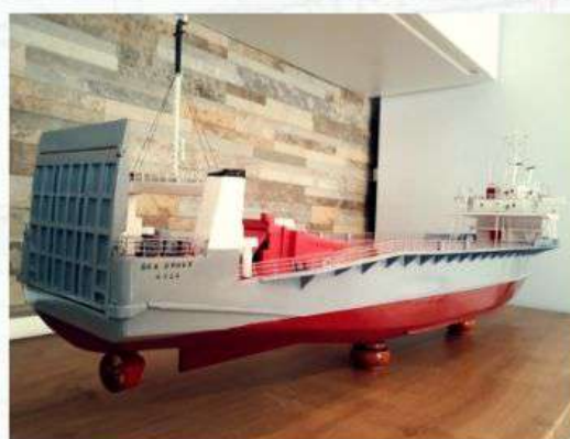
Razred VK, Izložak br.25 RO-RO Sea Drake Valter Ivanov, Novalja