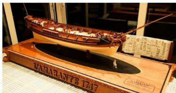
Razred C-3, Izložak br.8 Korveta L'Amarante Roland Vlahović, Lovran