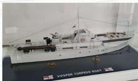
Razred C-6, Izložak br.14 MTB Vosper, Torpedni čamac Marko Smoković, Rijeka